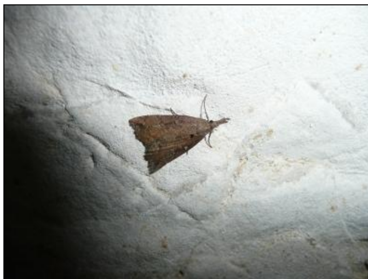
Slika 15. Hypena sp.

Za porodicu Noctuidae utvrđene su tri vrste. Vrsta Scoliopteryx libatrix uz prethodnu također vrlo česta vrsta leptira koja hibernira u špiljama kontinentalnih područja. U špiljama uz rijeku Kupu nađene su još dvije vrste, Pyrois effusa , u parenju te vrsta iz roda Hypena .