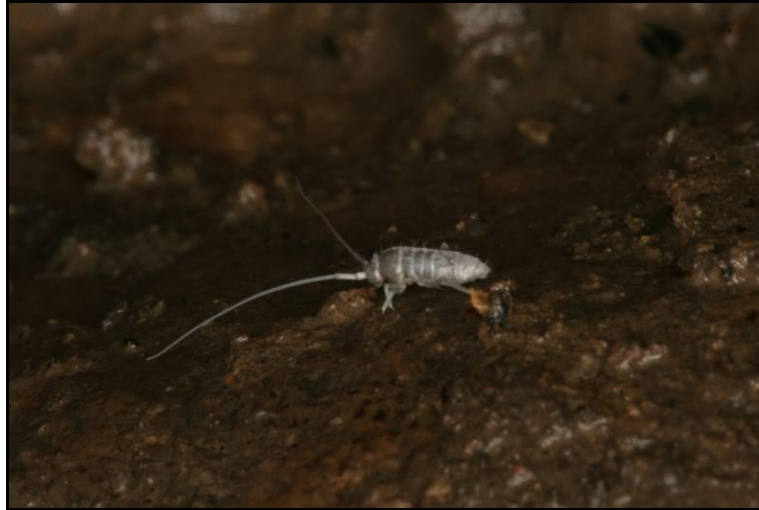
Slika 10. Tritomurus scutellatus , foto M. Lukić

U Vrlovci su pronađeni primjerci iz roda Cyphoderus koje pronalazimo slučajno u špiljama i koji ne pokazuju posebne prilagodbe na život u podzemlju.