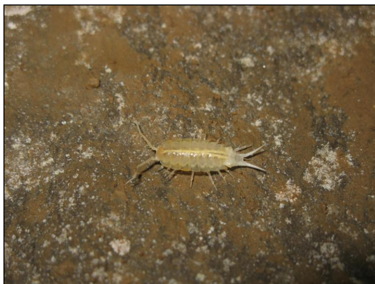
Slika 5. Titanethes albus

Od kopnenih jednakonožnih rakova ( Isopoda terrestria ) najučestalija je vrsta Titanethes albus . To je troglobiontna vrsta, rasprostranjena u SI Italiji, Sloveniji i Hrvatskoj, na sjevernom dijelu Dinarida. Potpuno je depigmentirana i slijepa, te je jedna od najvećih podzemnih vrsta jednakonožnih rakova u Hrvatskoj. Iz roda Androniscus su zabilježene dvije troglofilne vrste. Vrsta Androniscus roseus je rasprostranjena od istočne Francuske do Rumunjske, na sjeveru do južne Njemačke. Vrsta je pigmentirana, izrazito roze boje, te ima oči. Vrsta Androniscus stygius je rasprostranjena u JI Austriji, SI Italiji, Sloveniji i Z Hrvatskoj. Vrsta je slijepa i potpuno depigmentirana, te je znatno više prilagođena na podzemlje od vrste A. roseus .