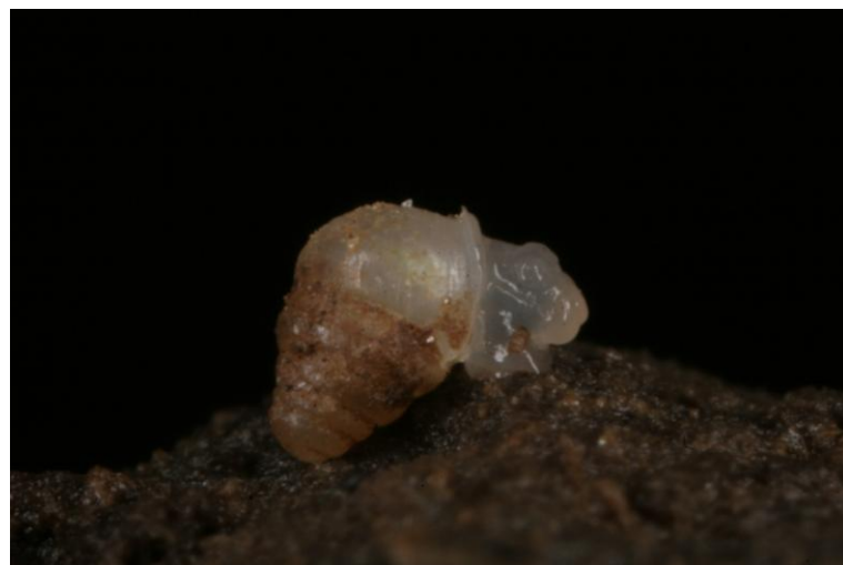
Slika 2. Zospeum sp.

Od pauka utvrđena je vrsta Troglohyphantes excavatus , rasprostranjena u Alpama i Dinaridima s najjužnijim nalazištem kod Plitvičkih jezera. Troglofilnog je karaktera.