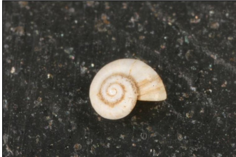
Slika 1. Hauffenia media

Iz Vrlovke je opisan pužić Hauffenia media . To je vodeni, vrlo sitan pužić, rasprostranjen u Hrvatskoj i Sloveniji. U Hrvatskoj je do sada pronađen samo u Vrlovki, te je kritično ugrožen. Od puževa utvrđen je špiljski puž iz roda Zospeum .