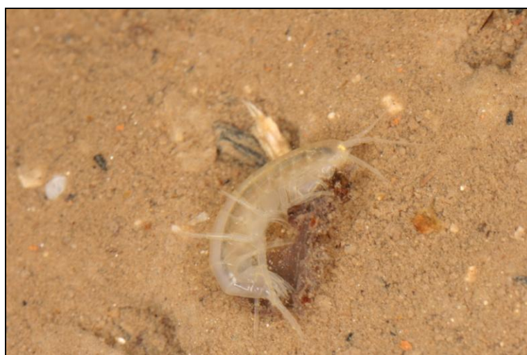
Slika 8. Niphargus sp.; foto M. Lukić

U Vrlovcisu utvrđeni rakušci roda Niphargus , čija je taksonomska analiza u tijeku.