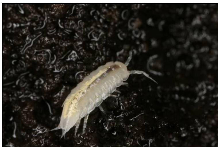
Slika 7. Androniscus stygius

U Vrlovcisu utvrđeni rakušci roda Niphargus , čija je taksonomska analiza u tijeku.