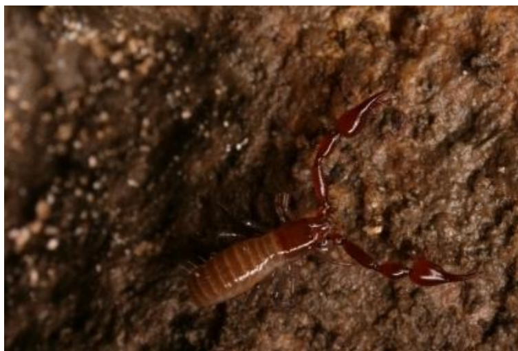
Slika 3. Roncus cf. lubricus

trogломorfni karakter i potrebna su daljnja specijalistička istraživanja za točnu taksonomsku determinaciju.