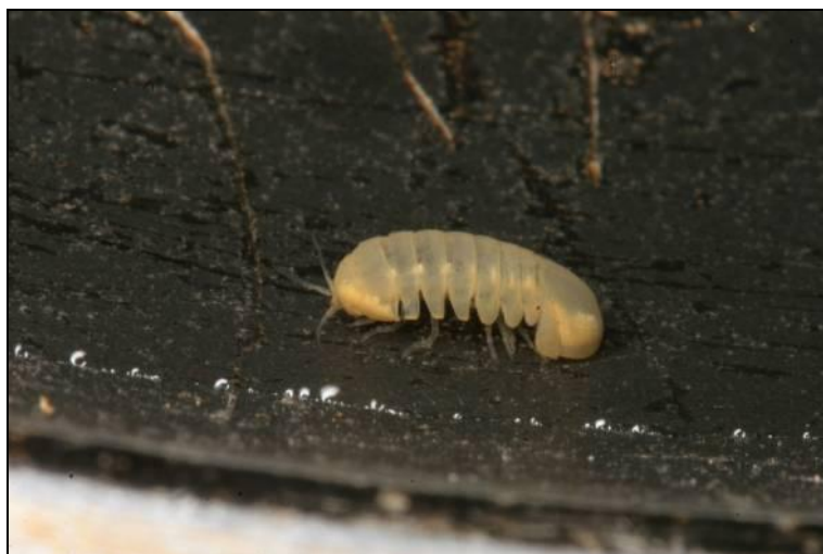
Slika 4. Monolistra velkovrhi

Od kopnenih jednakonožnih rakova ( Isopoda terrestria ) najučestalija je vrsta Titanethes albus . To je troglobiontna vrsta, rasprostranjena u SI Italiji, Sloveniji i Hrvatskoj, na sjevernom dijelu Dinarida. Potpuno je depigmentirana i slijepa, te je jedna od najvećih podzemnih vrsta jednakonožnih rakova u Hrvatskoj. Iz roda Androniscus su zabilježene dvije troglofilne vrste. Vrsta Androniscus roseus je rasprostranjena od istočne Francuske do Rumunjske, na sjeveru do južne Njemačke. Vrsta je pigmentirana, izrazito roze boje, te ima oči. Vrsta Androniscus stygius je rasprostranjena u JI Austriji, SI Italiji, Sloveniji i Z Hrvatskoj. Vrsta je slijepa i potpuno depigmentirana, te je znatno više prilagođena na podzemlje od vrste A. roseus .