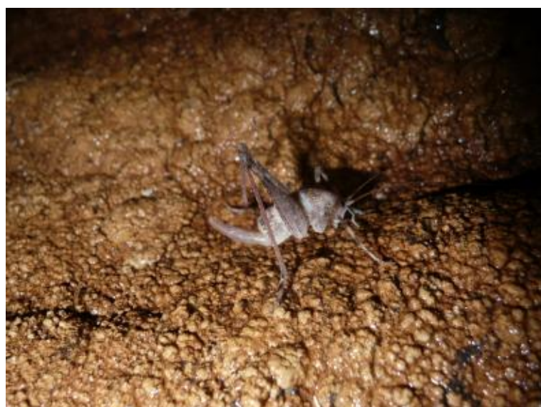
Slika 13. Troglophilus cavicola

Vrsta Troglophilus neglectus opisana je iz Istre, a proširena na području sjevernih Dinarida. Vrsta Troglophilus cavicola opisana je iz Slovenije i često se nalazi u istim objektima, ali ne dijeli ista staništa s prethodnom vrstom, odnosno obitava dublje u objektima.