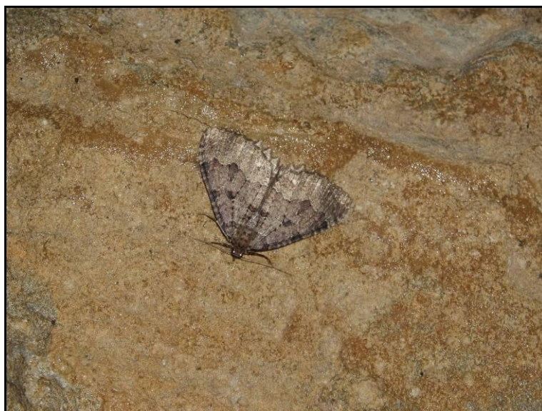
Slika 14. Triphosa dubitata , foto M. Pavlek

Iz skupine leptira (Lepidoptera) za faunu područja Kamanja utvrđene su četiri vrste. Iz porodice Geometridae utvrđen je rod Triphosa s vrstom Triphosa dubitata . Ova vrsta je najčešći subtroglofilni leptir na području Hrvatske gdje redovito zimuje u speleološkim objektima.