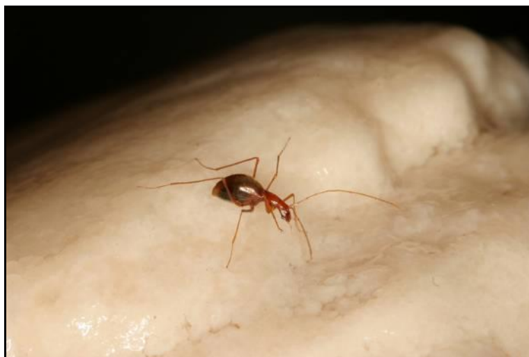
Slika 12. Parapropus sericeus

U gotovo svim speleološkim objektima područja Kamanja iz skupine ravnokrilaca (Orthoptera) redovito nalazimo troglofilne špiljske konjice. Na osnovi sakupljenih primjeraka iz četiri objekta te prethodno sakupljenih primjeraka u zbirdkama, utvrđen je rod Troglophilus sp.