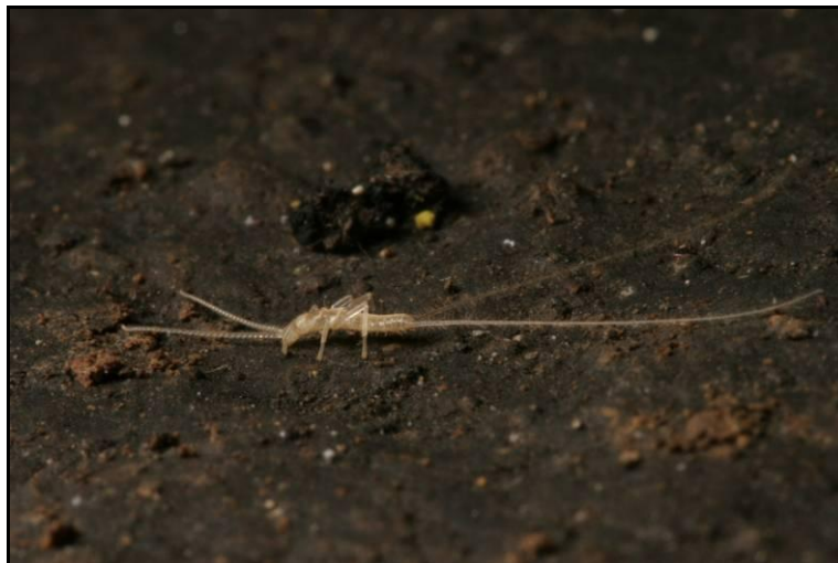
Slika 11. Plusiocampa cf. nivea

Iz grupe dvorepaca ( Diplura ) u brojnim objektima sakupljeni su primjerci iz porodice Campodeidae, roda Plusiocampa i troglobiontnog podroda Stygiocampa , koji je zastupljen sa šest vrsta u europskim špiljama. Svi sakupljeni primjerci pokazuju troglobiontni karakter, a prema preliminarnoj determinaciji najvjerojatnije se radi o troglobiontnoj vrsti Plusiocampa (S.) nivea . U Vrlovci je nađena i subtroglofilan primjerak iz roda Campodea .