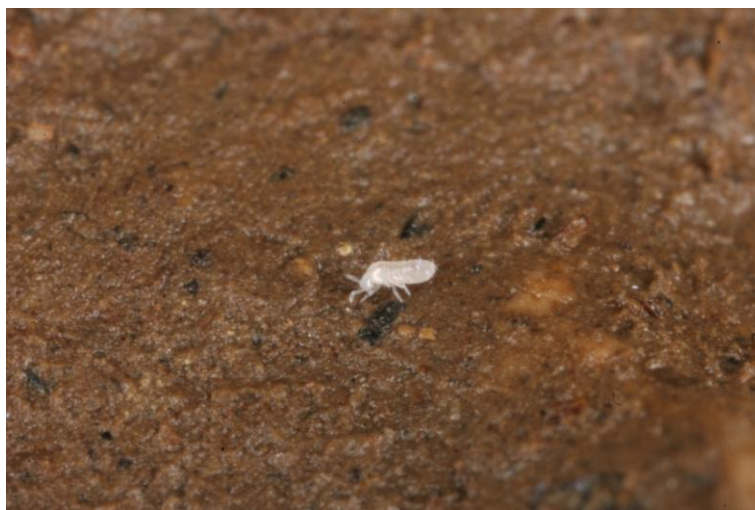
Slika 9. Oncopodura cavernarum

Iz porodice Oncopoduridae sakupljeni su primjerci koji najvjerojatnije pripadaju vrsti Oncopodura cavernarum . Ova vrsta opisana je iz jame sa same granice Slovenije i Italije kod Trsta a u Hrvatskoj je njeno najjužnije nalazište trenutno Dinara. Za konačnu potvrdu ove vrste potrebno je sakupiti komparativni materijal s njenog tipskog lokaliteta.