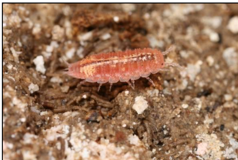
Slika 6. Androniscus roseus